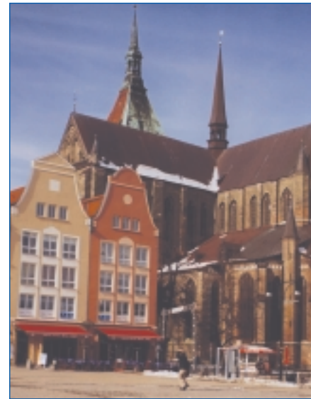
Neuer Markt mit Marienkirche

Kehren wir zurück zur Kröpeliner Straße und bummeln vorbei an den barocken und klassizistischen Gebäuden, meist mittelalterlichen Ursprungs, zum Universitätsplatz. Hier lässt es sich am Brunnen der Lebensfreude gut verweilen. Hinter der Universität befindet sich das Kloster zum Heiligen Kreuz, in dem ein Großteil des Kulturhistorischen Museums untergebracht ist. Dieses Zisterzienserkloster bietet als einzige vollständig erhaltene Klosteranlage im Land mit der dreischiffigen Hallenkirche im Stil norddeutscher Backsteingotik ein Bild seltener Geschlossenheit. Erfreulicherweise wurden in