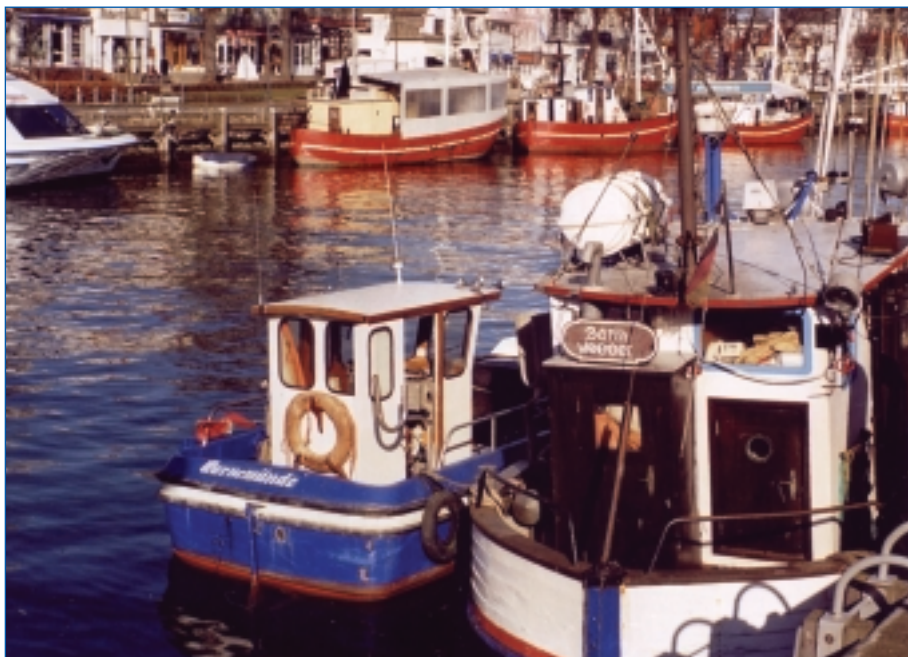
Fischkutter am 'Alten Strom'

Wenn Sie als Rollstuhlfahrer dem Meer ganz nah sein möchten, sollten Sie versuchen, auf einem der Strandzüge, die mit Gummimatten ausgelegt sind, hinunter zum Wasser zu gelangen. Der Wind weht mitunter die Matten zu, so dass der Weg etwas beschwerlich sein kann. Oder Sie gehen zurück zum Leuchtturm und schlagen den Weg zur Westmole ein, auch hier ist das Meer zum Greifen nahe. Werfen Sie einen Blick auf die gegenüberliegende Uferseite der Warnow, dort entsteht der neue Yachthafen, der zu den größten an der deutschen Ostseeküste zählt. Ab diesem Jahr wird die Warnemünder Woche, eine große internationale Segelsportveranstaltung, erstmalig auch von dem neuen Yachthafen ausgetragen. Die hervorragenden Segelbedingungen auf dem Regattarevier vor Warnemünde sind kaum zu toppen.