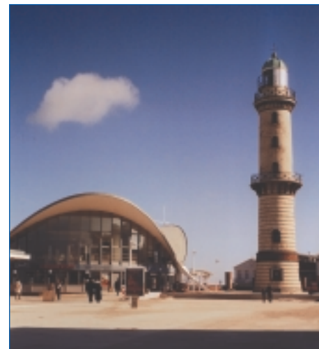
„Teepott“ mit Warnemünder Leuchtturm

Wenn Sie eine Hafenrundfahrt unternehmen möchten, haben Sie verschiedene Möglichkeiten. Rollstuhlfahrer können das z. B. mit dem Motorschiff „Markgrafenheide“ tun, denn hier müssen Sie beim Einstieg keine Stufen überwinden. Anschließend geht es weiter in Richtung Leuchtturm, einem gut 100 Jahre alten und 30 Meter hohen Denkmal. Daneben befindet sich der „Teepott“ mit seiner eigenwilligen Dachkonstruktion. Ehemals Treffpunkt für Jung und Alt wurde er endlich saniert, und Sie finden hier heute verschiedene Restaurants, eins davon mit Mecklenburger Spezialitäten, Souvenirshops und eine Ausstellung.