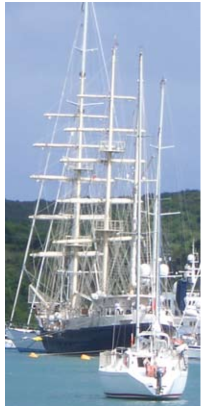
Die Tenacious in Antigua/Karibik

Den ersten Tag an Deck verbrachten wir mit Sicherheitsübungen, die im Verlauf der See-reise immer wieder durchgeführt wurden. Sicherheit auf hoher See ist eine ernste Angelegenheit und durch die Routine an Bord fühlten wir uns bald eingebettet in ein System aus Teamwork und Sicherheitsmaßnahmen. Die Welt außerhalb der unseren auf See, hörte für uns auf zu existieren. Wir hatten keine Verbindung mehr zur Außenwelt, das Satellitentelefon wird nur