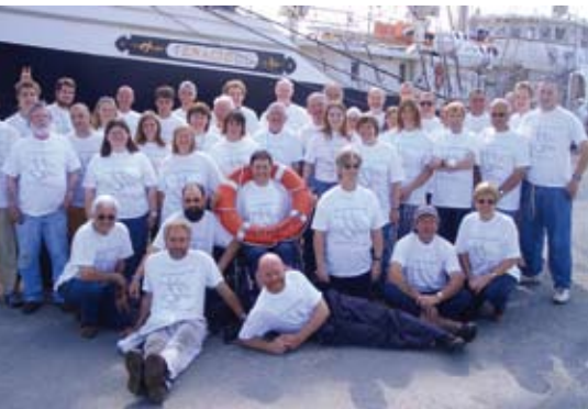
Die Crew der Tanacious