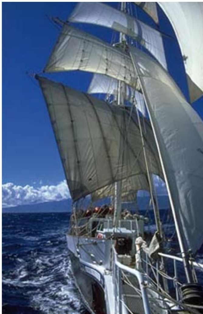
Die Lord Nelson