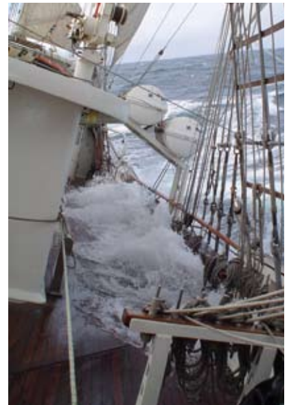
Wasser auf dem Deck der Tenacious.

mich auf der Pier umsah, hatte ich das Gefühl, dass ich meinen Traum soeben erst begonnen und nicht beendet hatte und fragte mich, „wo sind all die Delphine geblieben?“