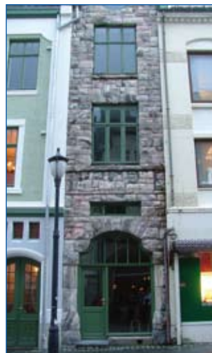
Das schmalste Haus in Ålesund

Ohnehin, das Essen an Bord – und natürlich die Gastfreundschaft der norwegischen Crew fernab von Alltagshektik und Touristenströmen – sind großartig. Zum Frühstück und Mittag erwartet uns ein skandinavisches Buffet, am Abend ein Dreigangmenü. Ich esse fast ausschließlich Fisch und andere Leckerbissen aus dem Meer: Hummer, Krabben, Muscheln, Räucherfisch und natürlich Hering in allen erdenklichen Zubereitungsformen. Aber auch der Rentierschinken ist eine Delikatesse. Nur den süßen Frühstückskäse Gjetost überlasse ich meinen Mitreisenden. Ganz in Ruhe speisen und plaudern wir an den uns zugewiesenen Tischen. Jetzt im Winter sind nur 50 Touristen an Bord statt möglicher 1000. Das bringt die Reisenden näher zueinander.