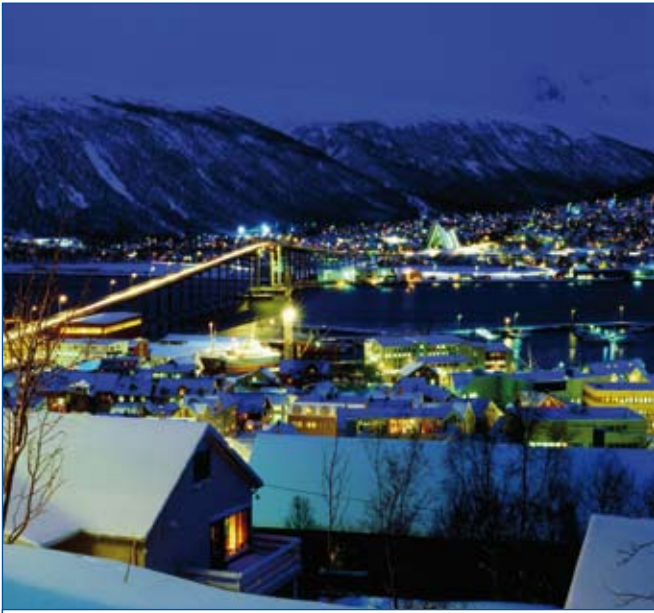
Blick auf Tromsø bei Nacht

Am nächsten Morgen mache ich klugerweise gleich um zehn einen kleinen Bummel. Eine dünne Schneeschicht bedeckt die Gehwege, doch keine Spur von Glätte. Ich werfe zunächst einen Blick auf das Vertshuset Skarven, ein Restaurant-Haus mit mehreren Lokalen unter einem Dach, u. a. mit Tromsøs berühmtestem Fisch- und Schalentier-Restaurant, wo auch Wal- und Seehundgerichte angeboten werden, und laufe dann weiter durch die Shoppingmeile mit ihren alten Holzhäusern, die jetzt weihnachtlich geschmückt sind. Zum letzten Mal genieße ich die frische Winterluft, die die Gedanken so klar macht. Als ich gegen halb zwölf ins Hotel zurückkehre, ist alles bereits wieder in die Polarnacht versunken.