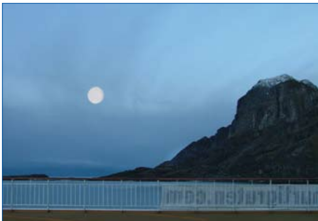
Der Mond ist fast immer zu sehen