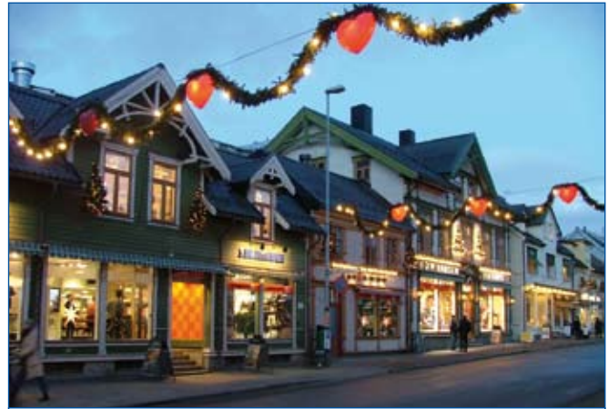
Weihnachtliche Stimmung in einer Geschäftsstraße in Tromsø