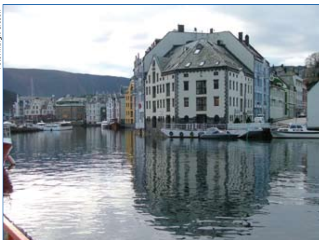
Blick auf Ålesund

wir wo anlegen und welche Ausflüge angeboten werden. Heute erreichen wir gegen Mittag Ålesund, die „Jugendstilstadt“. Eine geführte Stadtwanderung steht auf dem Programm. Die Temperaturen sind mild, kein Schnee, keine Glätte, und ich entschlief mich, den Rundgang mit der Gruppe so lange mitzumachen, wie es mir vom Tempo her möglich ist.