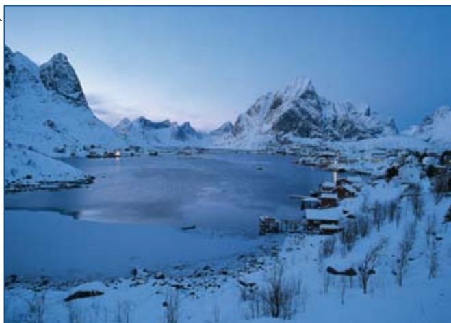
Vorbei an kleinen Fischerdörfern

beobachten. Wir folgen dem Golfstrom in Richtung Norden, dessen warme Strömung die Fjordküste im Winter eisfrei hält.