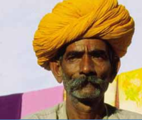
Ein Tuchhändler in Rajasthan/Indien