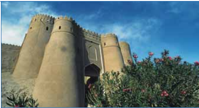
Die Stadt Bam/Iran vor dem Erdbeben