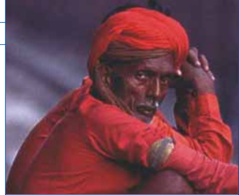
Ein indischer Porter

die Lebensweise der Inder so vielfältig ist, lassen sie andere Denkweisen neben den ihren bestehen und versuchen nicht, ihre Lebenseinstellung auf andere zu übertragen. Für Andreas Pröve grenzt es an ein Wunder, dass eine Milliarde Menschen mit all ihren verschiedenen Religionen so friedlich zusammen leben können. Er hat erfahren, dass die Inder auch sehr nervig sein können, größte Achtung hat er jedoch immer wieder vor ihrer Lebenskunst, denn sie haben scheinbar überhaupt keine Probleme, die widrigsten Lebensumstände zu akzeptieren und damit zufrieden zu sein.