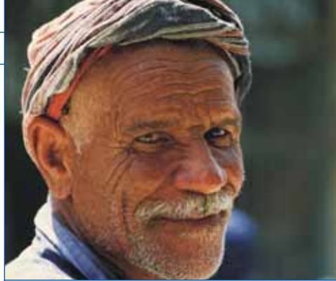
Ein "Baluchi-Man" im Iran