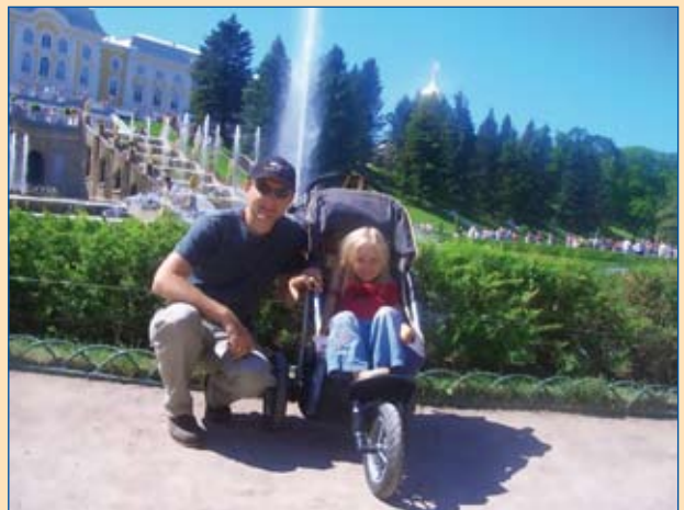
Ausflug zum Sommerpalast