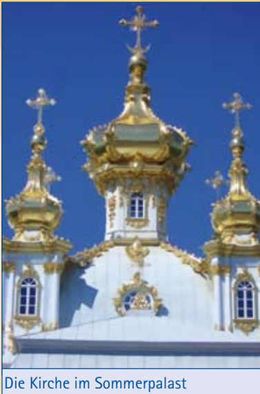
Die Kirche im Sommerpalast

Kirche findet gerade eine Hochzeit statt und so kann ich wenigstens ein Photo von einem Priester machen. Übrigens: Hier können Priester auch verheiratet sein.