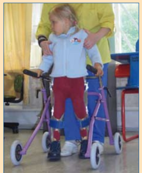
Laufen, Laufen, Laufen