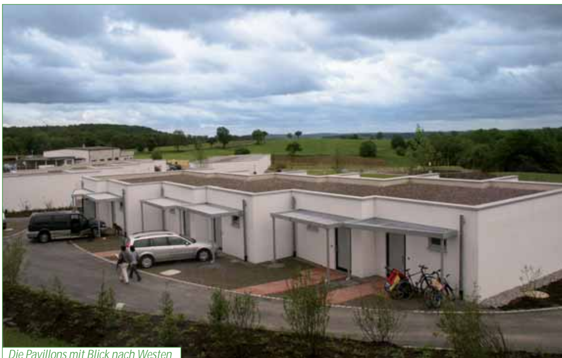
Die Pavillons mit Blick nach Westen

In das Haus ist auch ein IT-Fortbildungszentrum integriert. Fünf großzügige Seminar- und Schulungsräume stehen mit umfangreicher Tagungstechnik zur Verfügung. Durch die Förderung dieses Zentrums mit 600.000 € wird durch das Land ein beispielhaftes IT-Projekt im ländlichen Raum unterstützt, das Menschen mit Behinderung neue Perspektiven und Chancen in Beruf und Gesellschaft eröffnet. Manfred Sauer will mit diesem Fortbildungszentrum querschnittgelähmten Menschen den Zugang zu neuen Informationstechnologien eröffnen, es ist aber auch gleichzeitig für jedermann offen.