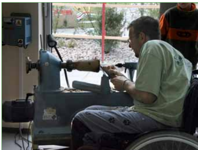
Exemplarische Werkstätten: z. B. Holz