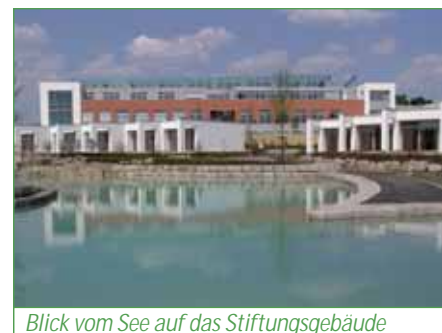
Blick vom See auf das Stiftungsgebäude

Für die Zeit ihres Aufenthaltes stehen den Gästen, egal ob als Tages-, Kurz- oder Langzeitgast, sowohl 29 Zimmer sowie – insbesondere für einen Langzeitaufenthalt – 20 Pavillons zu Verfügung, die in einen Landschaftsgarten integriert sind. Natürlich sind alle Unterkünfte barrierefrei gestaltet. Allerdings hat man sich dabei nicht in jedem Fall an die DIN-Norm gehalten, denn gerade für Menschen mit einer Querschnittlähmung sind die extrem hohen Toiletten oft gar nicht nutzbar. Diese Freizügigkeit beim Bauen wurde von vielen Besuchern des Hauses als sehr positiv bewertet.