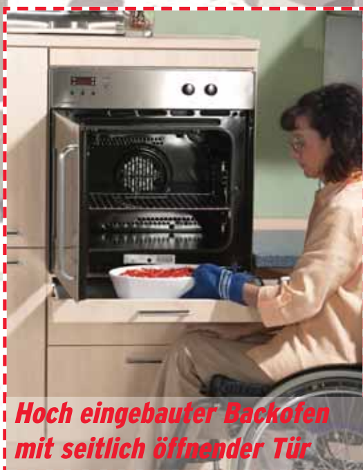
Hoch eingebauter Backofen mit seitlich öffnender Tür