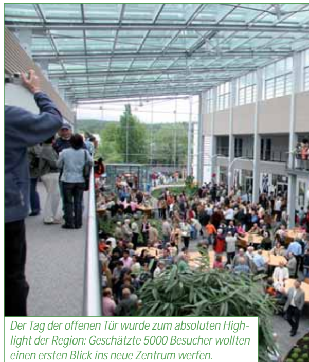
Der Tag der offenen Tür wurde zum absoluten Highlight der Region: Geschätzte 5000 Besucher wollten einen ersten Blick ins neue Zentrum werfen.

Frau Geng, Pflegewissenschaftlerin aus dem Paraplegiker-Zentrum in Nottwil, ist gerade dabei, ein Sei-