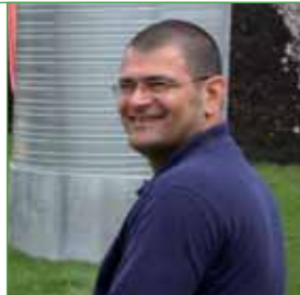
Internationaler Partner: Mantos aus Griechenland