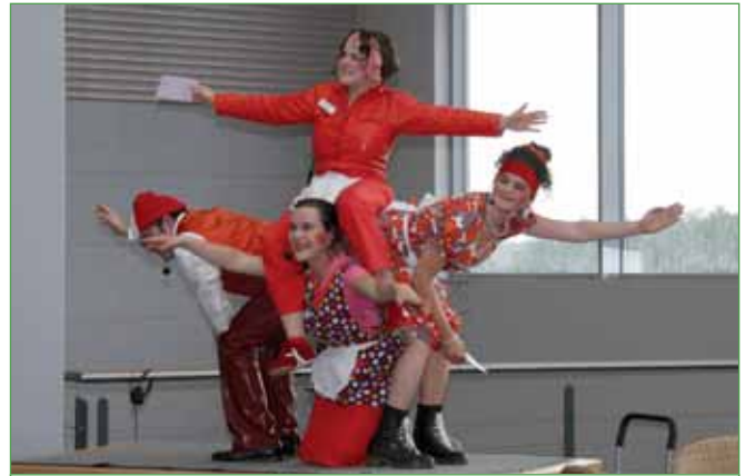
Aus der Schweiz – das Habsburger Servierquartett

Endlich finde ich doch einen freien Platz an der – speziell auf die Höhe von Rollstuhlfahrern zugeschnittenen – Bar. Auf den extravaganten Barhockern mit Traktorsitz kann ich richtig gut sitzen – ohne hochzuklettern, wie sonst bei Barhockern üblich.