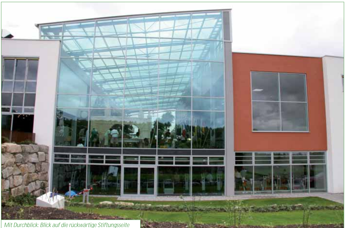
Mit Durchblick: Blick auf die rückwärtige Stiftungsseite