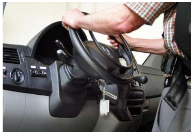
Gas und Bremse werden per Hand bedient.