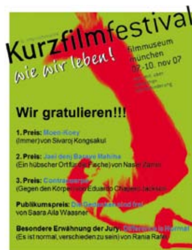
Plakat des Filmfestivals "Wie wir leben"

Ziel des Festivals ist es, zwischen den Filmemachern und den Menschen mit Behinderung eine Kommunikation herzustellen,