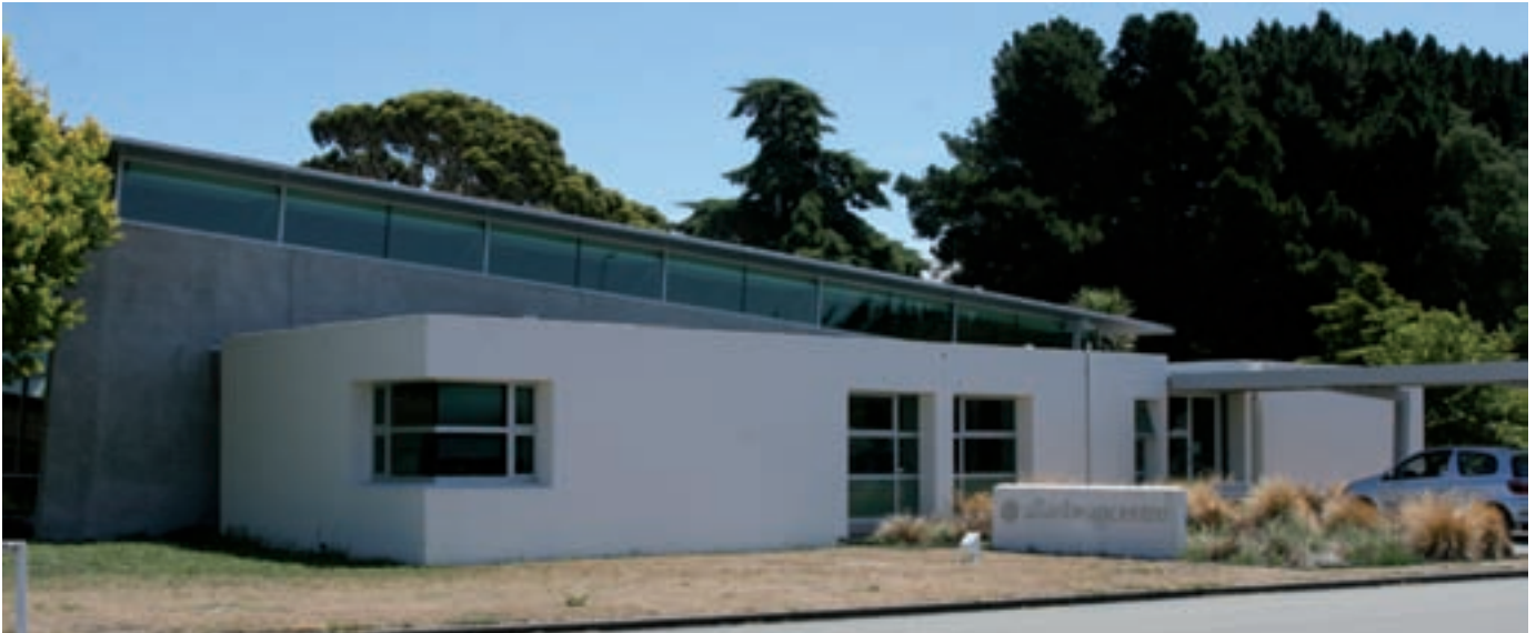
Das Allan Bean Center, 2002 fertiggestellt, ist eines der jüngsten Gebäude auf dem Klinikgelände

D as Allan Bean Center ist ein etwas futuristisch wirkender Neubau auf dem Gelände des Burwood Hospital und Sitz der „Burwood Academy of Independent Living“. Der Name der Institution ist Programm. Hier dreht sich alles darum, Rückenmarksverletzten die Rückkehr in ein unabhängiges Leben zu ermöglichen. Andrew ist Tetraplegiker und lebt das Motto der Stiftung, der er vorsteht. In ihren Statuten heißt es: „Der New Zealand Spinal Trust initiiert Programme und Projekte, die die Unterstützung und die Unabhängigkeit von Menschen mit Rückenmarksverletzungen fördern.“ Das Burwood Hospital, in einem ruhigen Viertel am Rande von Christchurch gelegen, beherbergt eine von zwei „Spinal Units“ des Landes. Wer in den südlichen Regionen Neuseelands einen Unfall mit Rückenmarksverletzung erleidet, wird in der Regel im Burwood Hospital landen. Eine zweite Spinal Unit, in Auckland gelegen, ist für den Norden zuständig.