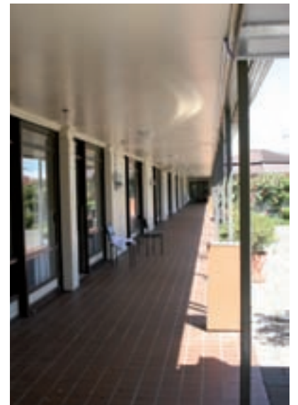
Freundliche Atmosphäre: Jedes Krankenzimmer verfügt über eine Tür ins Freie.

Natürlich kommt mir zunächst einmal vieles sehr bekannt vor. Therapieeinrichtungen, Krankenzimmer, Aufenthaltsräume – in den grundlegenden Dingen unterscheidet sich eine Rehabilitation in Neuseeland nicht von der gleichen Prozedur