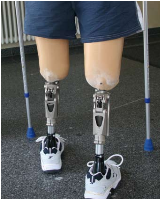
Mit allen Mitteln werden die Patienten wieder auf die Beine gestellt – wie dieser doppelt obersehenkelamputierte Mensch mit Hilfe zweier polyzentrischen Prothesen-Kniegelenke