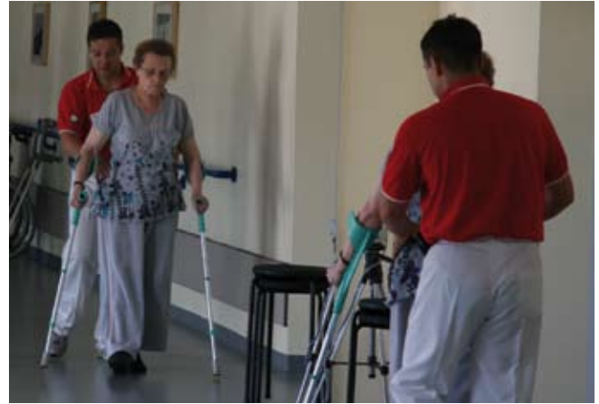
Gehtraining vor der Spiegelwand

Im Obergeschoss ist die Gangschule zu finden, die mit gleich zwei ständig eingeschalteten Videokameras arbeitet. Diese nehmen aus zwei unterschiedlichen Blickrichtungen die Bewegungen der Patienten auf und projizieren diese auf zwei Monitore,