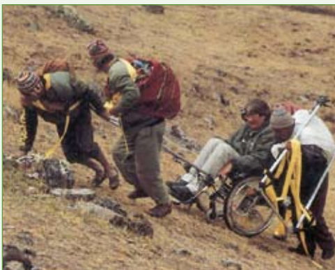
... aber manchmal ist menschliche Hilfe nicht zu ersetzen