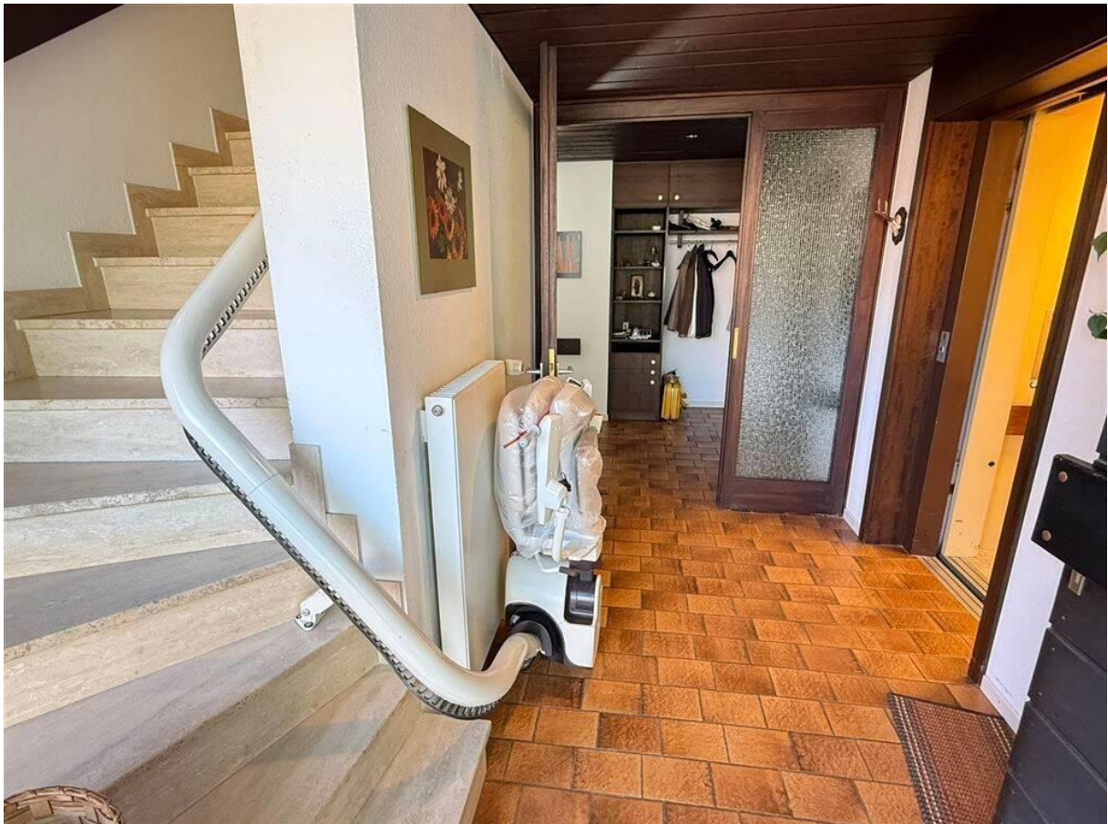
Hausflur im Erdgeschoss mit Aufzug zum Keller und Treppenlift zum Dachgeschoss