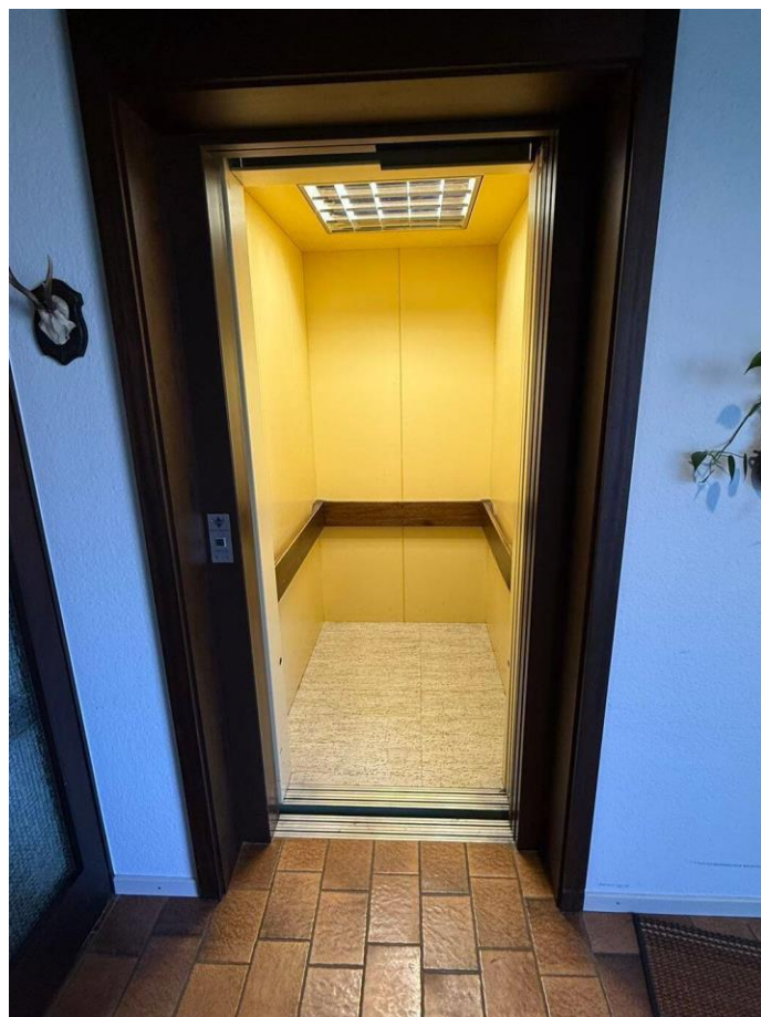
Aufzug zum Keller