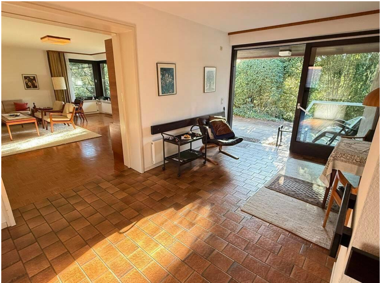
Essdiele mit Wohnzimmer und Terrasse