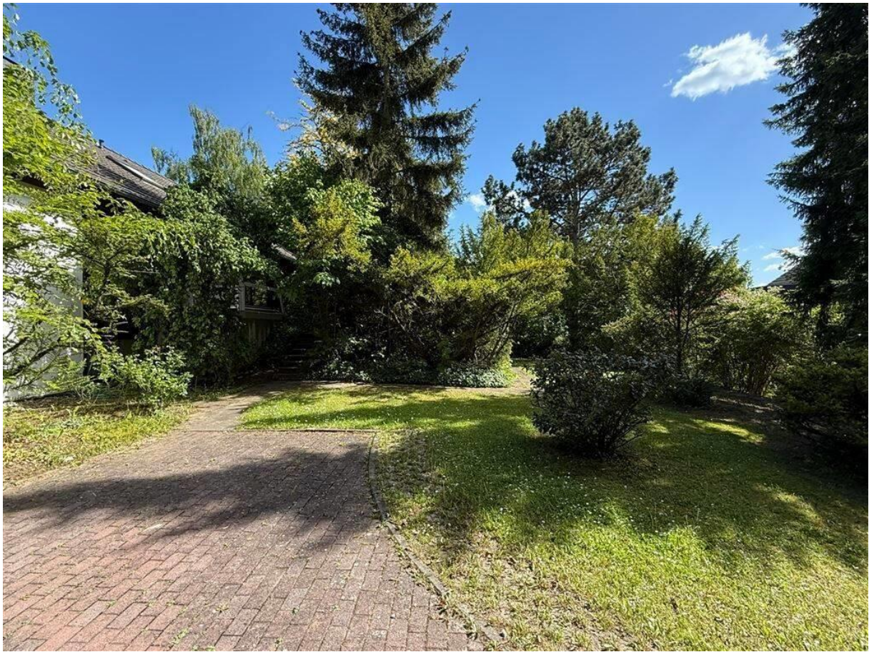
Garten mit Abstell- bzw. Wendeplatz