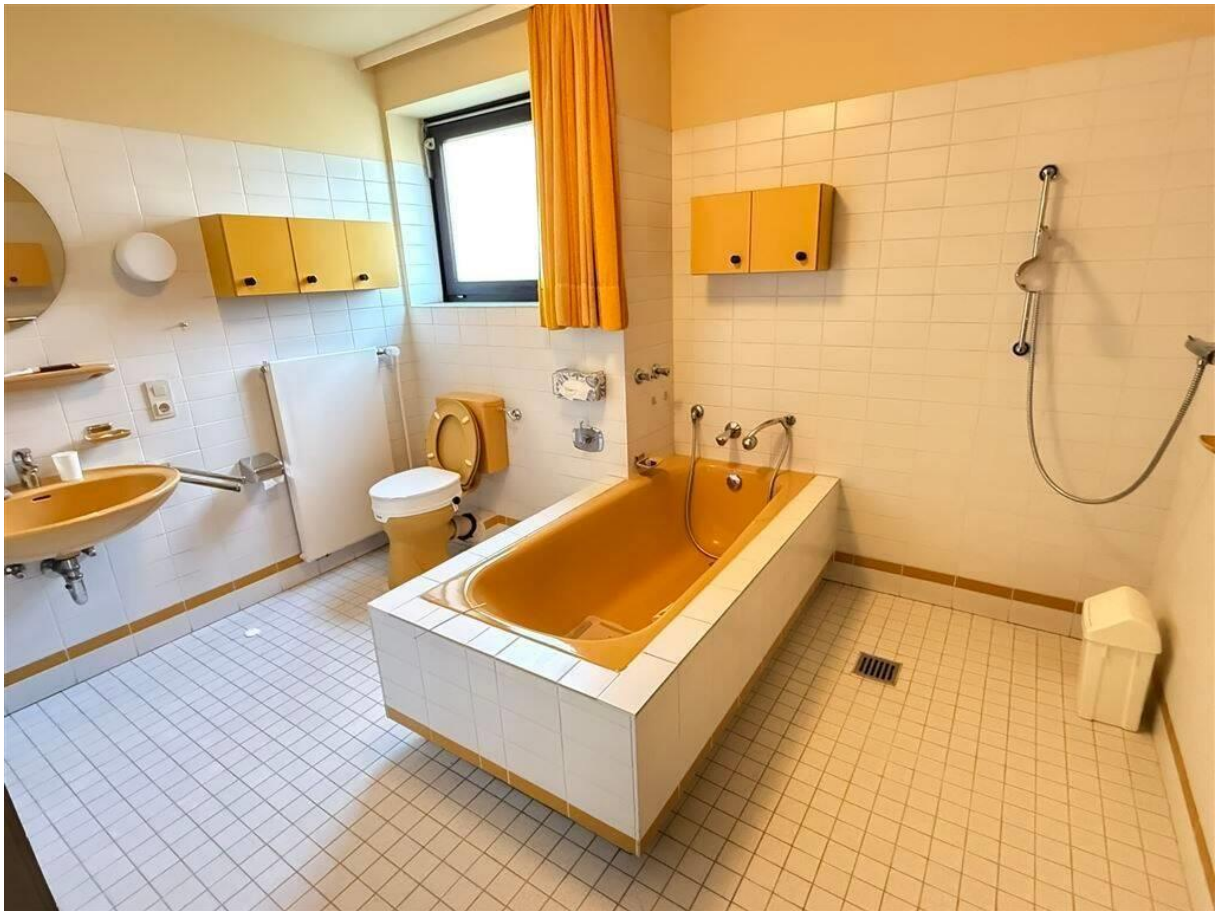
Badezimmer im Erdgeschoss