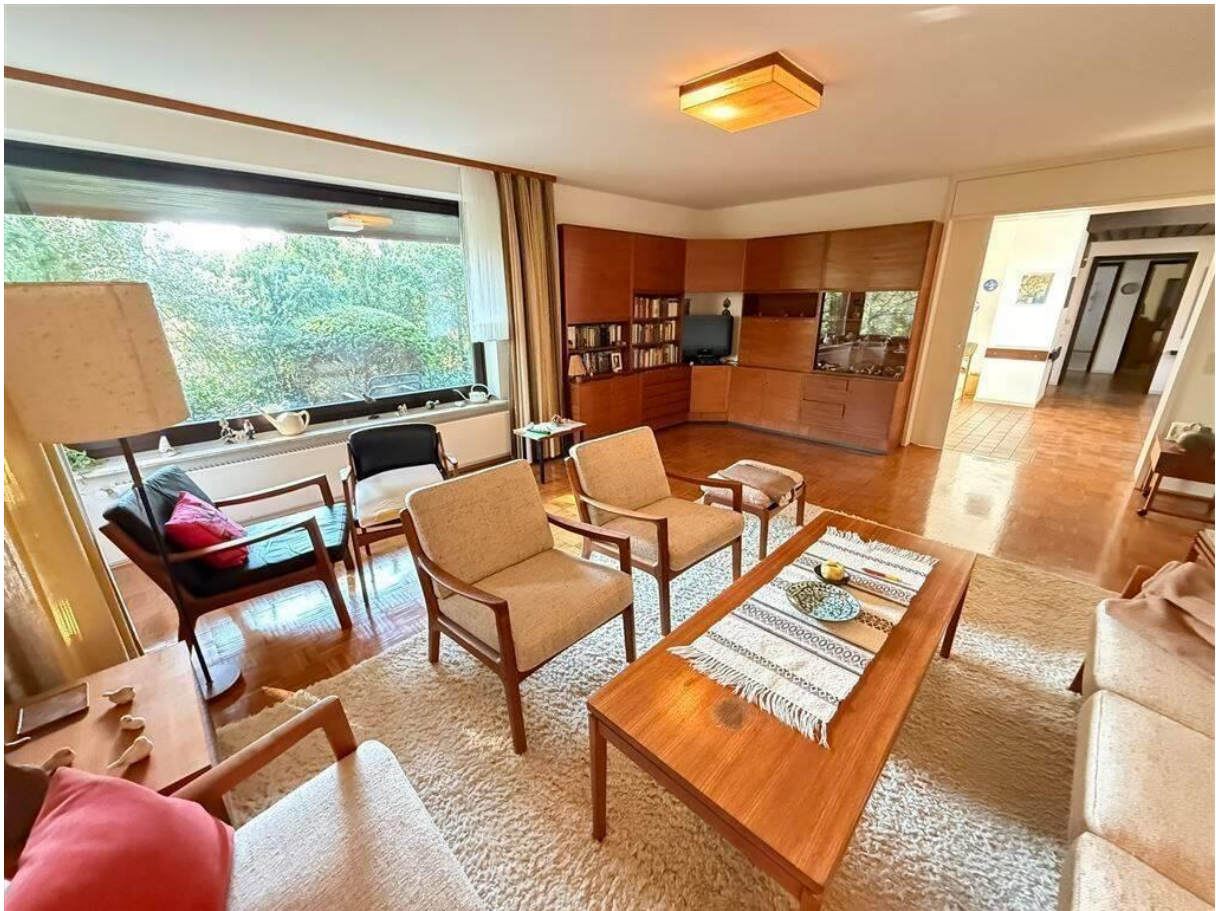
Wohnzimmer und Essdiele