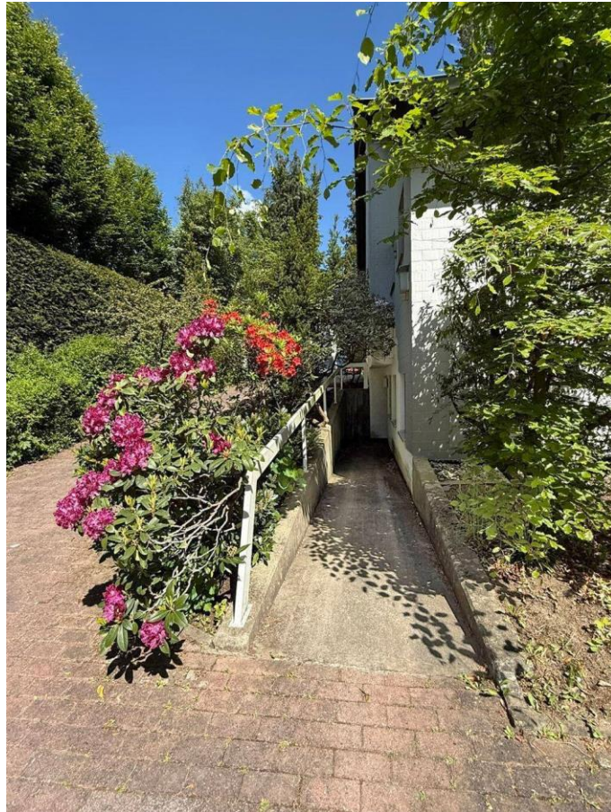
Kellereingang mit Rampe