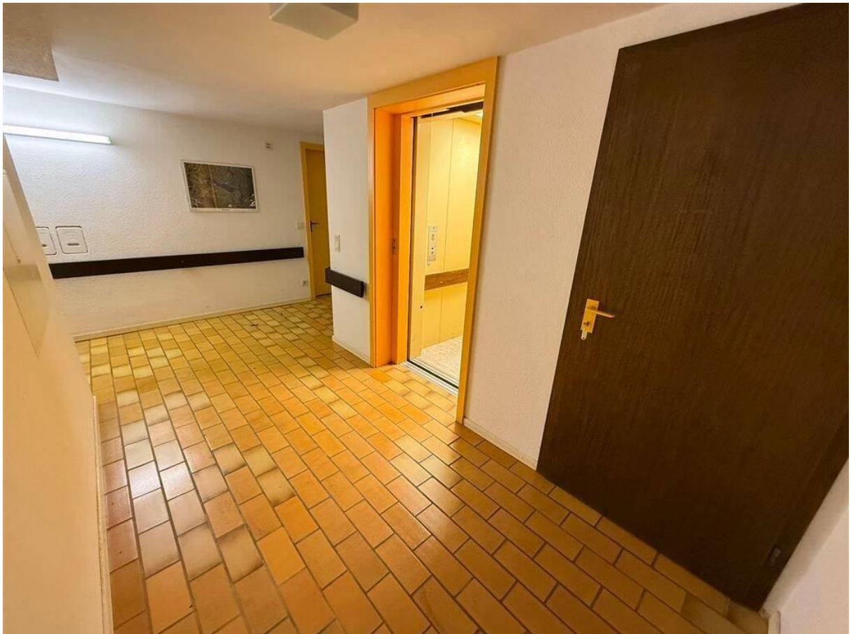
Kellerflur mit Aufzug