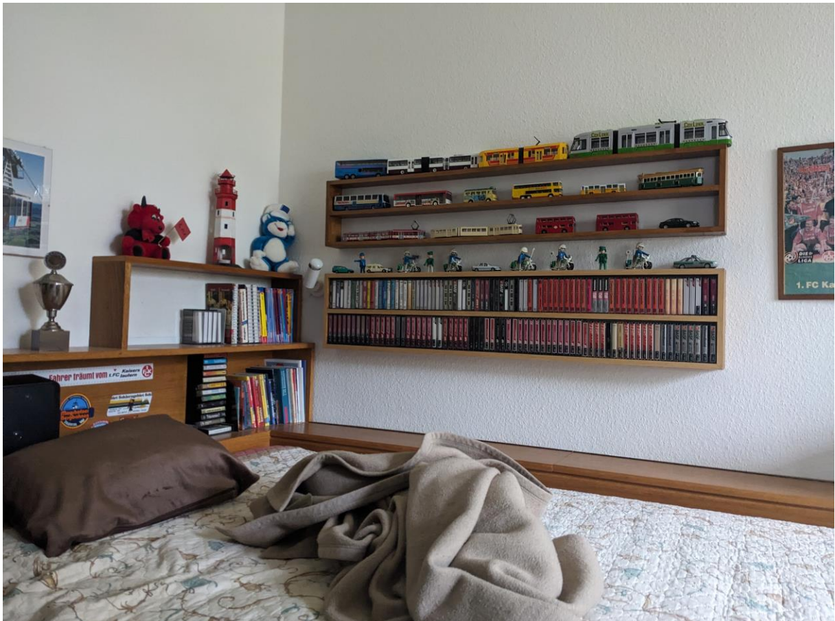
Kinderzimmer mit französischem Bett (für Rollstuhlfahrer/-innen gut geeignet)