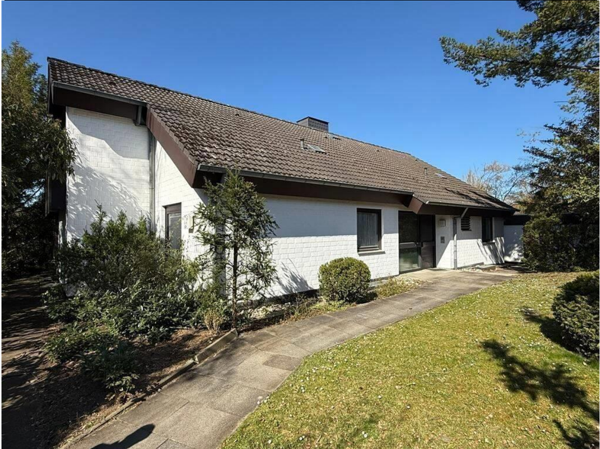
Vorgarten mit Hauseingang